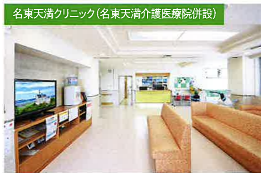
名東天満クリニック(名東天満介護医療院併設)

医療法人栄寿会 天満病院 〒770-0042 徳島県徳島市蔵本町1丁目51 tel.088-632-1520