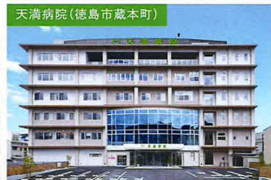
天満病院(徳島市蔵本町)